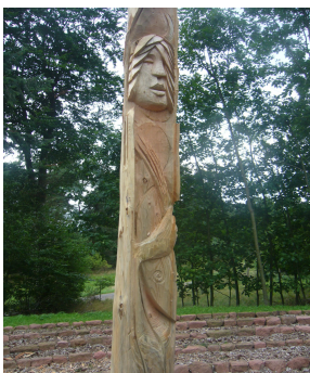
Freude und Tanz