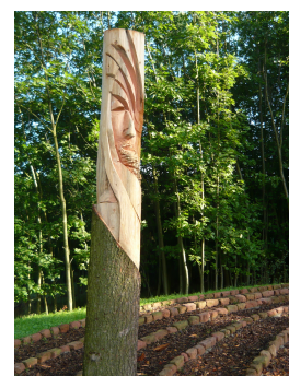
Hiob – Leid - Tod