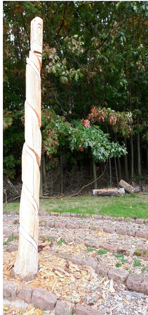
Weg zum Himmel