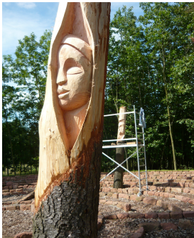
Geburt und Anfang

Im Sommer 2010 war der Holzkünstler Aleksander Majerski aus Polen für zwei Wochen in Alsenborn. Er schnitzte aus 5 abgestorbenen Bäumen folgende Kunstwerke: