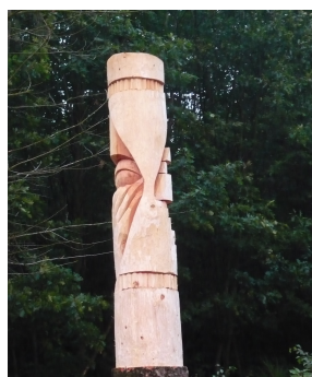
Arbeit und Mühe