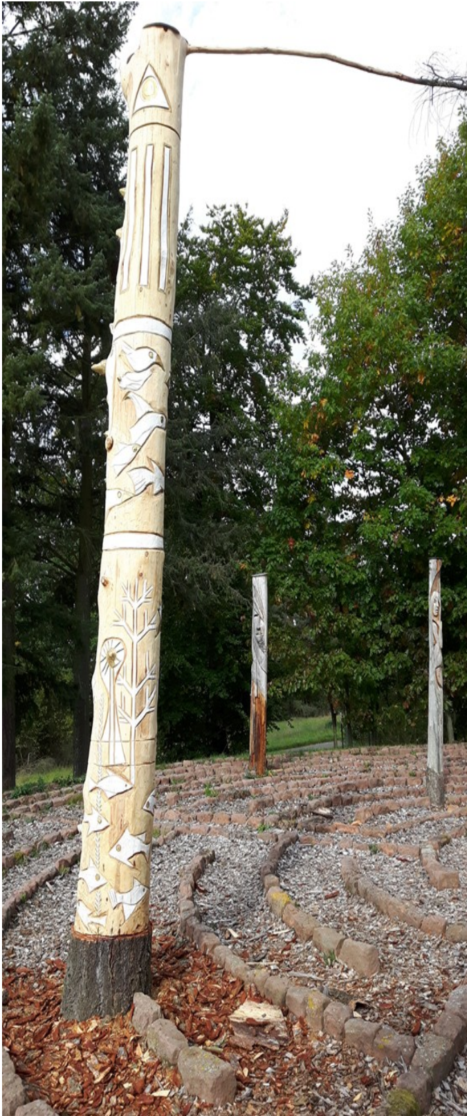
Verantwortung für die Schöpfung

2017 kam Aleksander Majerski wieder nach Alsenborn. Dabei entstanden folgende Skulpturen: